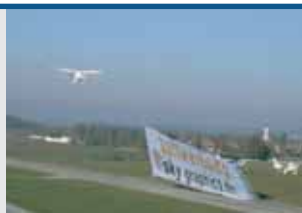
Abflug mit Schleppbanner