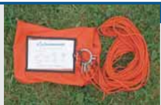
Die Seilspinnne für Schleppbanner

Sollten Sie noch Fragen haben, oder Sie möchten ein konkretes Angebot, stehen wir Ihnen selbstverständlich gerne zur Verfügung.