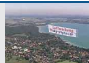
15.000 Blickkontakte pro Stunde